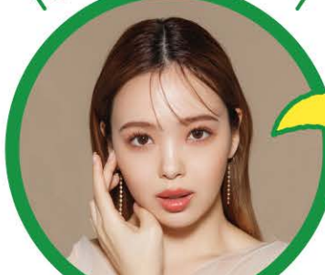
ふじた 藤田 ニコル モデル・タレント

私はこのプリントに書いてある家族性高コレステロール血症という病気を患っています。親から子供に遺伝する病気ですが、まだまだ認知度も低く、検査をする機会も少ないと思います。ただ、早期に発見できるとさまざまな対策が取れるので、ぜひこの機会にまずは健診に行ってみてください!