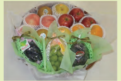
※イメージ