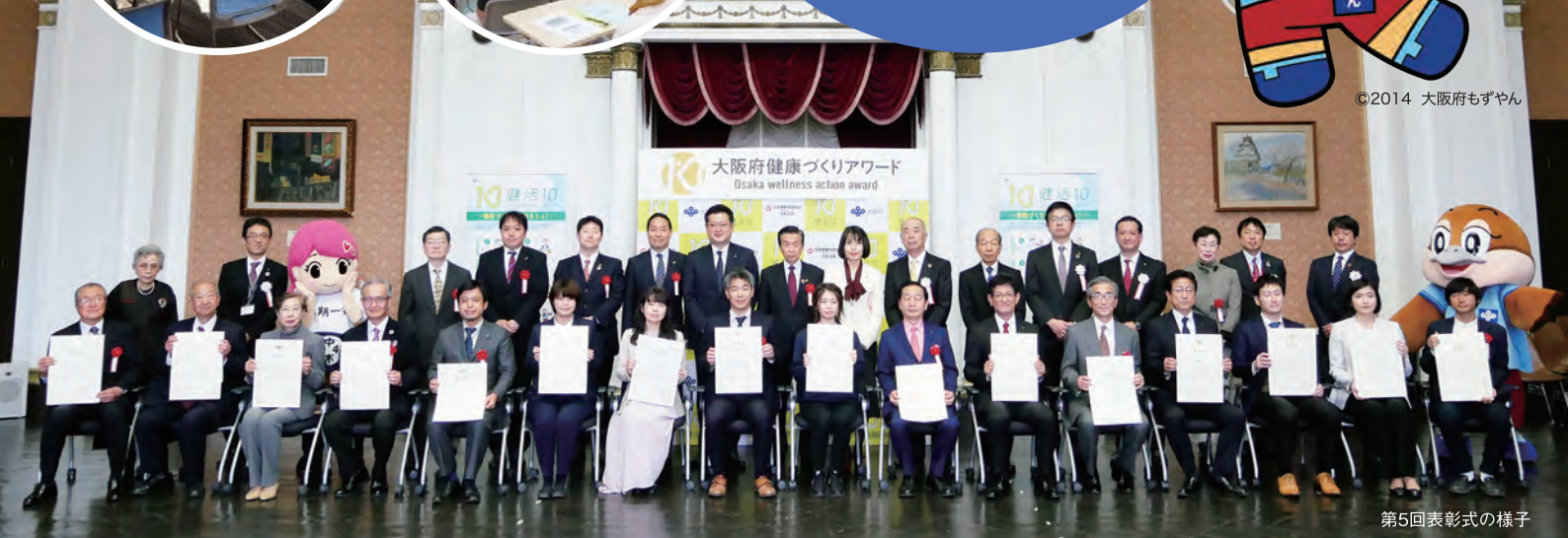
第5回表彰式の様子